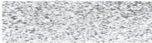
CL = beidseitig gekräuselt (fein)