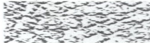
TK = Tropfen/Karo