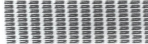
Z = Pyramide