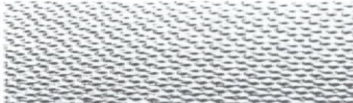
P = Perle