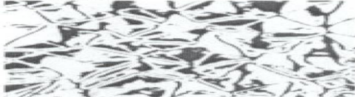
E = Eiskristall